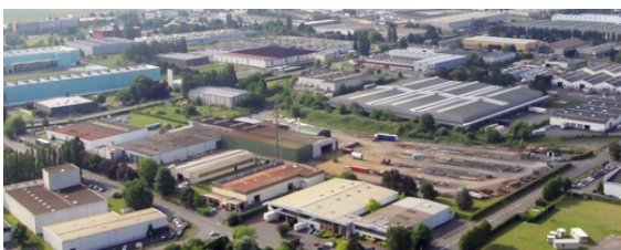
La zone industrielle